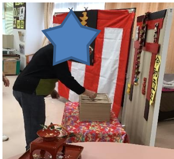
今年もよい年になりますように。