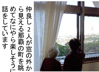
仲良し2人が窓の外から見える那覇の町を眺めてなにやら楽しそうに話をしています