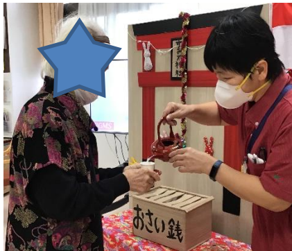
お賽銭箱にお賽銭を入れています