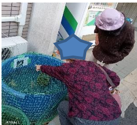
仲良く魚を眺めている所

おかげ様でお問合せも増えてきました。デイすみれの新聞や活動予定表、職員紹介等ブログをアップしていますので、よかったですらご覧になってください。