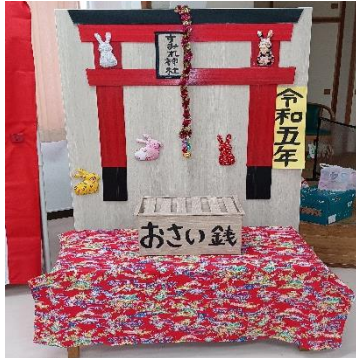
お賽銭は手作り貨幣を使っています